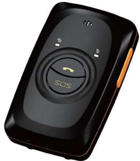
MeiTrack MT90 személykövető